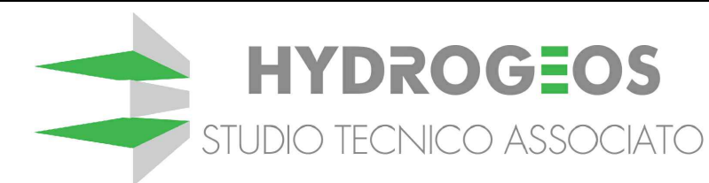
TAVOLA N° 05