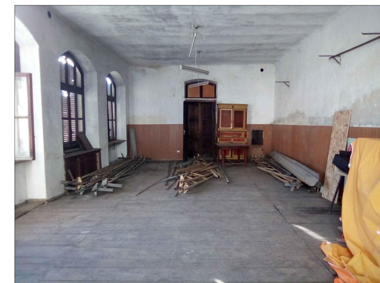
● 5 - INTERNO DELLA SALA