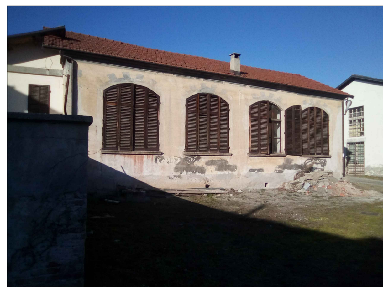
▲ 3 - PROSPETTO EST