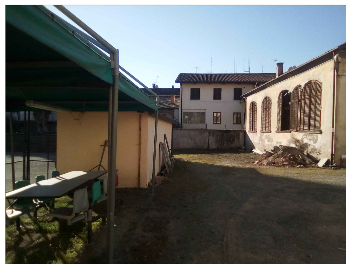
▲ 4 - ANGOLO NORD EST