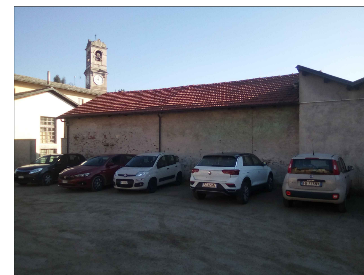
▲ 2 - PROSPETTO OVEST