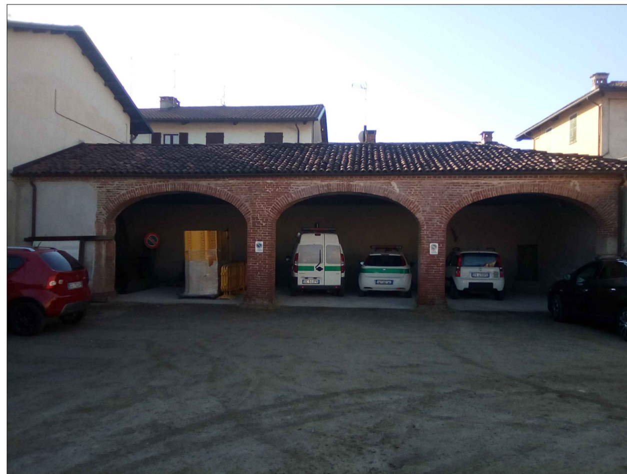
2 - PUNTO SI SCATTO - PROSPETTO NORD