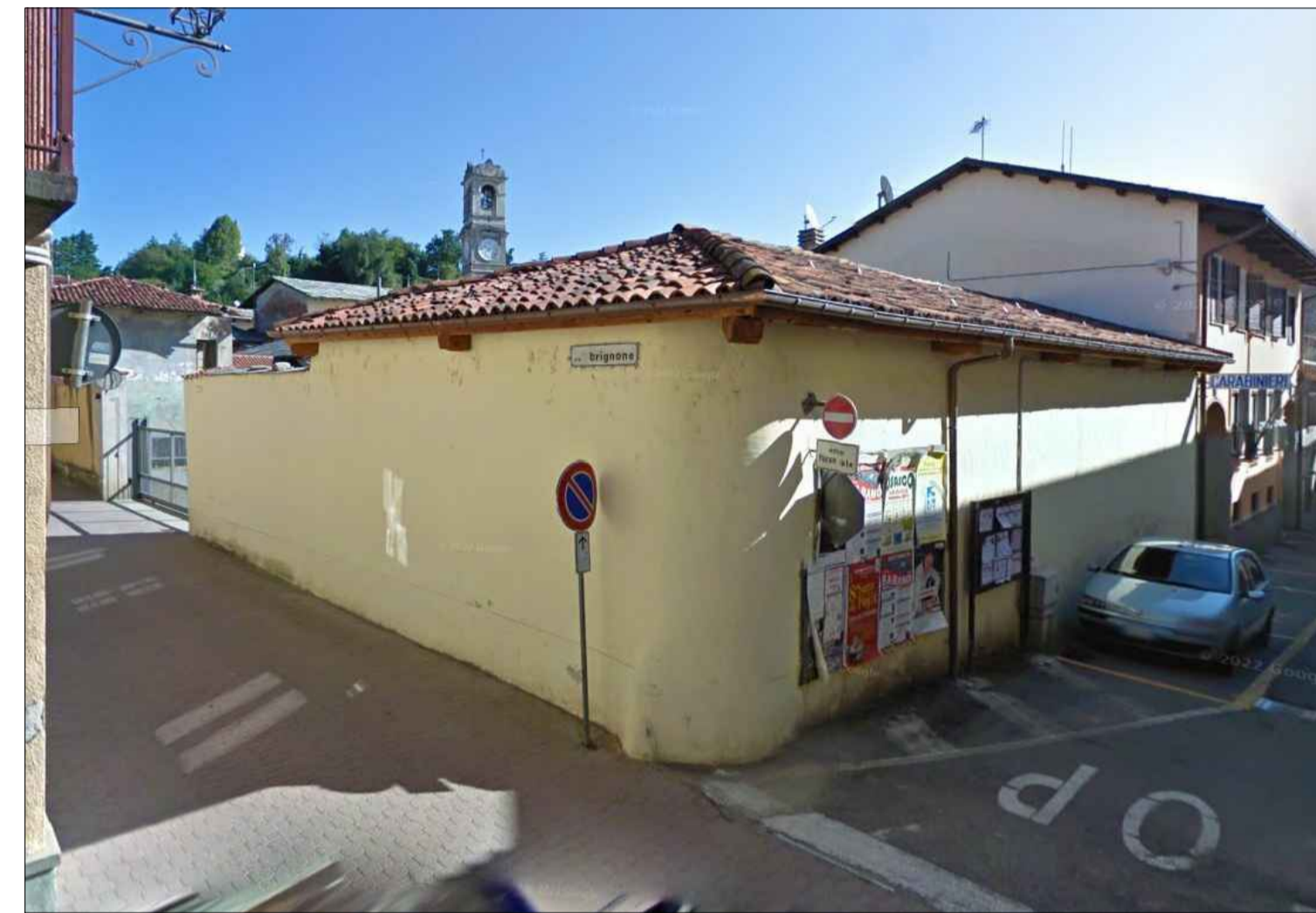
1 - PUNTO SI SCATTO - ANGOLO NORD / EST