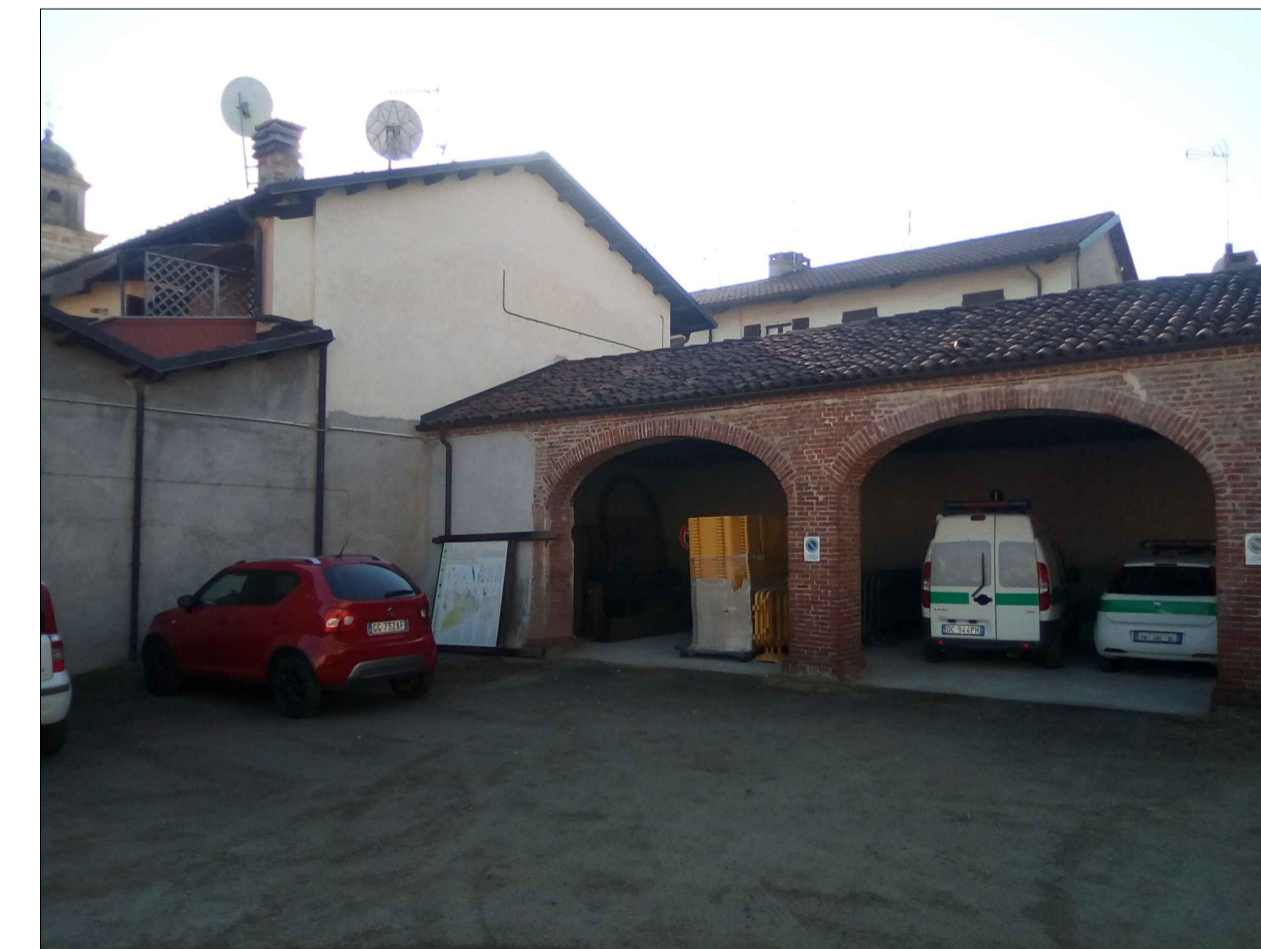
3 - PUNTO SI SCATTO - ANGOLO NORD / EST