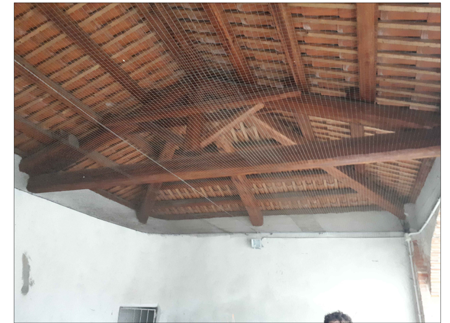
● - PUNTO SI SCATTO - ORDITURA LIGNEA