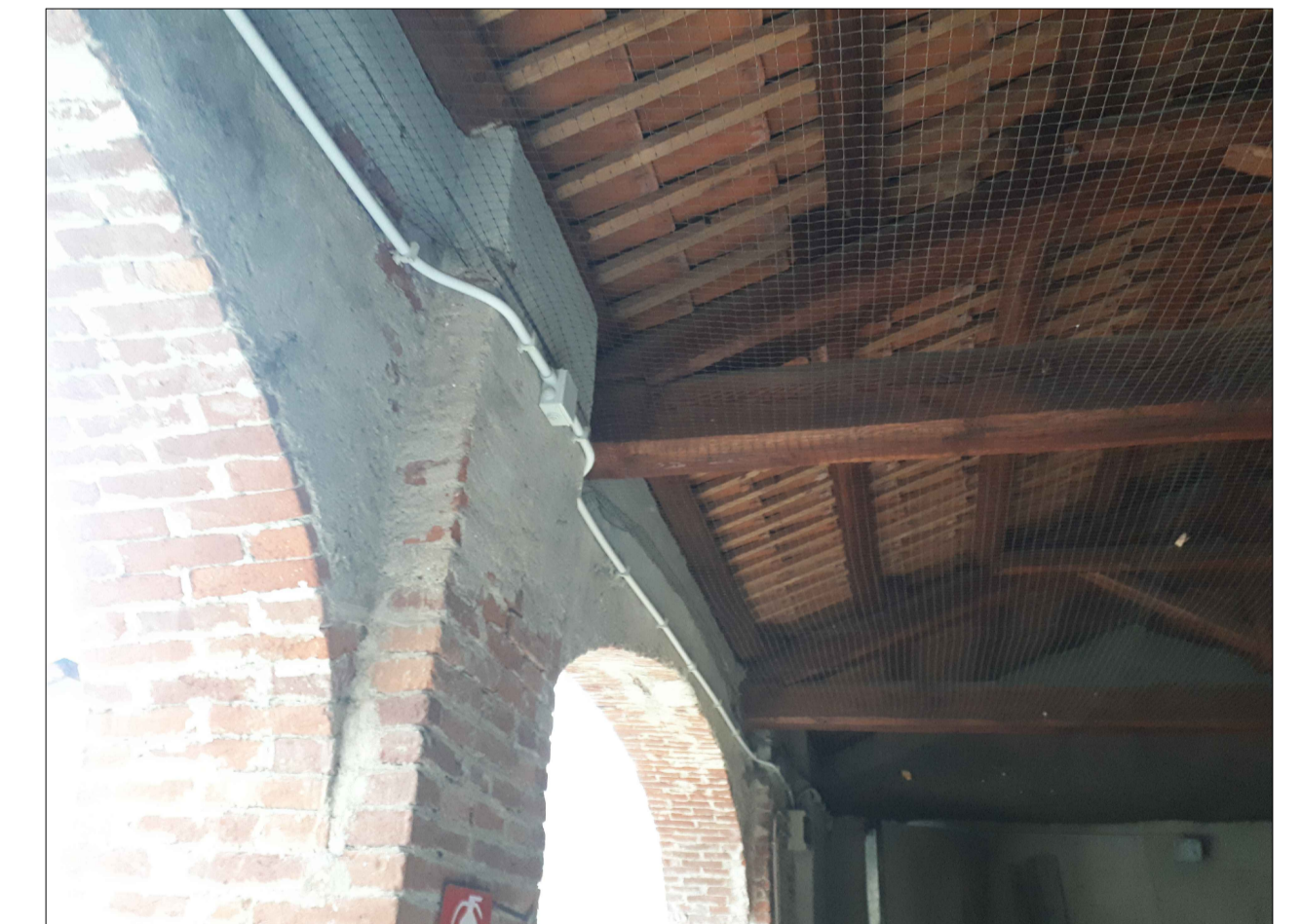
● - PUNTO SI SCATTO - ORDITURA LIGNEA